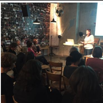
Lares im Cabaret Voltaire

Anmeldung bis zum 08.09. unter info.mittelland@f-s-u.ch