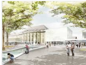
So soll der Bahnhofplatz dereinst aussehen.

St.Gallen. Der Bahnhofplatz soll aufgewertet und neu gestaltet werden. Heute wurde das Siegerprojekt des Gestaltungs-Wettbewerbs vorgestellt. - sda/MC