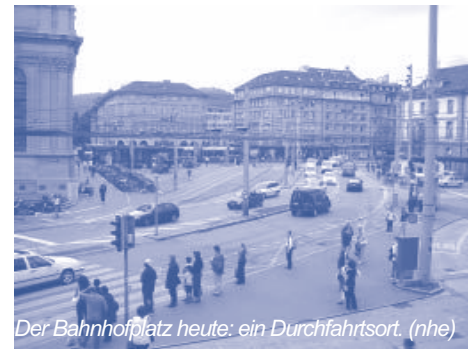
Der Bahnhofplatz heute: ein Durchfahrtsort. (nhe)

Nach vier Monaten steht ein neues Vorprojekt. Dieses wird unter der Federführung des Tiefbauamts der Stadt Bern zu einem Bauprojekt weiterentwickelt. Ziel ist es, ein funktional, gestalterisch und finanziell mehrheitsfähiges Projekt für die Volksabstimmung des Baukredits auszuarbeiten. Eine neue Projektorganisation wird erstellt, die den