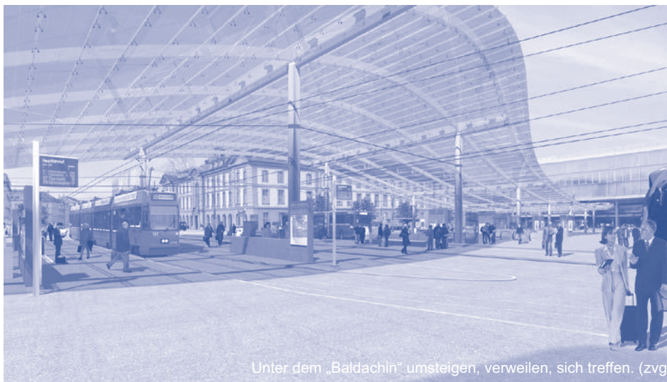
Unter dem „Baldachin“ umsteigen, verweilen, sich treffen.